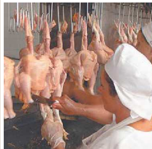
Avicultura é o setor que mais adiciona valor a seus produtos